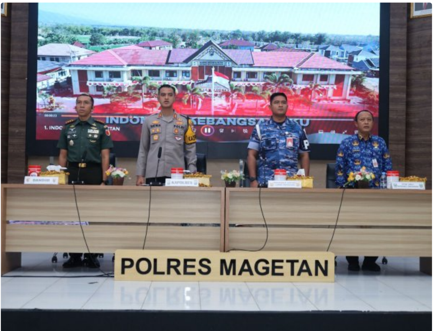
Dandim 0804/Magetan Hadiri Rakor Lintas Sektoral kesiapan operasi lilin 2024

Magetan. – Guna meningkatkan Sinergitas dalam rangka kesiapan operasi lilin 2024 pengamanan Hari Raya Natal 2024 dan Tahun Baru 2025 di wilayah Kabupaten Magetan yang aman dan kondusif.