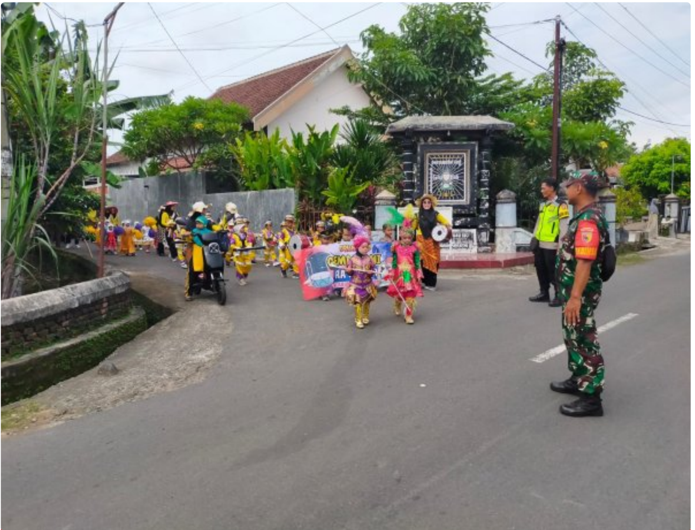
Gebyar Rojabiyah RA dan MI, Babinsa bersama Bhabinkamtibmas Amankan Jalannya Kegiatan Parade Drum Band